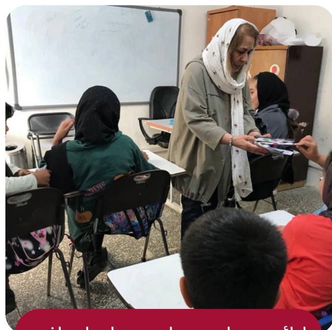
ارائه خدمات حمایتی سازمان یافته

نیازسنجی و اهدا بسته‌های معیشتی، وسایل و امکانات اولیه زندگی به صورت سازمان یافته و با شرایط خاص