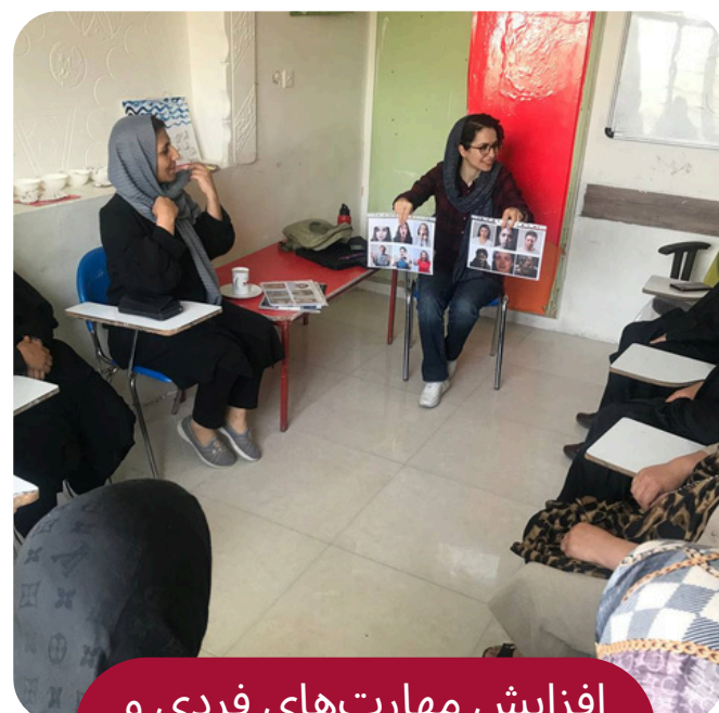
افزایش مهارت‌های فردی و گروهی زنان و کودکان

نیازسنجی و اهدا بسته‌های معیشتی، وسایل و امکانات اولیه زندگی به صورت سازمان یافته و با شرایط خاص