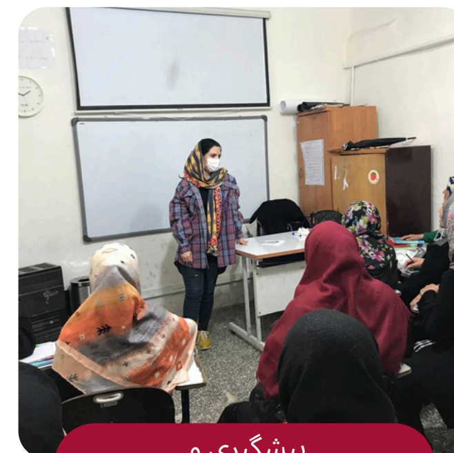
پیشگیری و کاهش آسیب‌های اجتماعی

ارائه خدمات روان‌شناختی و مشاوره‌ای؛ ارائه خدمات بهداشتی و درمانی؛ مداخله در بحران