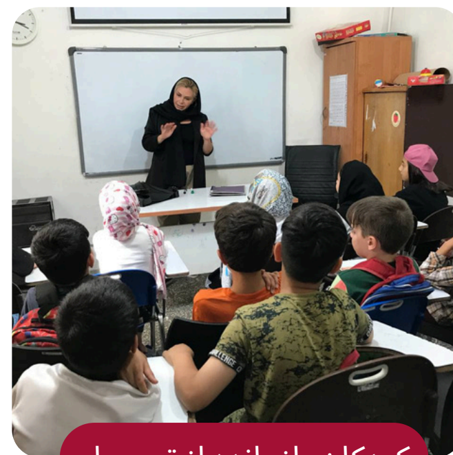
کودکان بازمانده از تحصیل

کسب سواد پایه به مادران با رویکرد توان افزایی افرادی که در جامعه‌ای آسیب دیده زندگی می‌کنند.