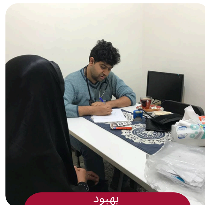
بهبود سطح زندگی فردی و خانوادگی