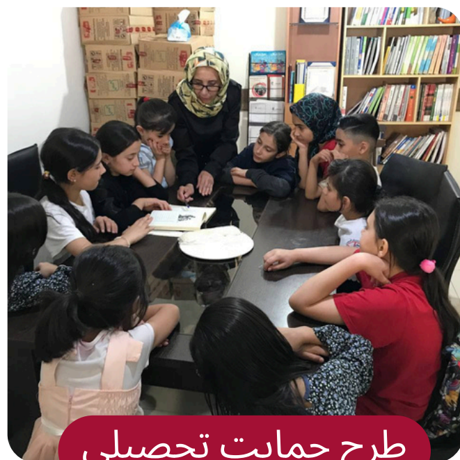
طرح حمایت تحصیلی

طرح «حمایت تحصیلی» به منظور حمایت از کودکانی که به واسطه فقر خانواده و نبود امکانات از داشتن شرایط تحصیلی مناسب و ادامه تحصیل محروم هستند، اجرا می شود.